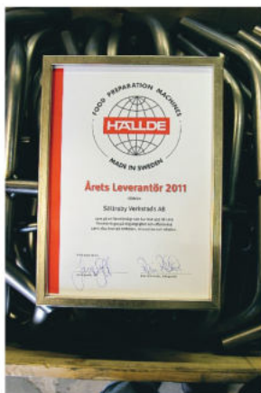
Tillgänglighet och effektivitet var kriterier som gav Sättraby verkstad utmärkelsen som årets leverantör.